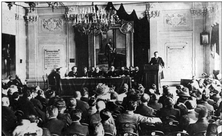
Съезд писателей. Петербург. 1910 год.

«О, эти гигантские просторы площадей, где можно делать смотр целым армиям. Тяжелые глыбы дворцов. Каменные всадники на памятниках — императоры и полководцы. Тусклое золото куполов Исаакия над мраморными громадами колонн, разве вся эта пышная красота не говорит о величии власти? "Город казарм", — скажет язвительный враг. Да, казарм. Город гвардии и преторианцев. Но разве власть когда-нибудь опиралась на что-нибудь иное, как на штыки солдат?» — писал близкий к акмеистам прозаик Сергей Ауслендер.