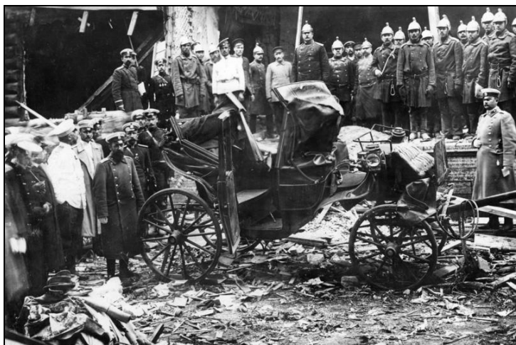
Остатки экипажа после взрыва на даче П. А. Столыпина.