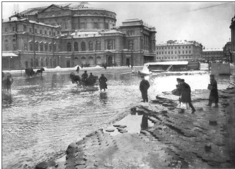
Наводнение в Ленинграде 1924 года. Театральная площадь

В 1833 году Пушкин напишет «Медный всадник». «Кумир на бронзовом коне», «чьей волей роковой над морем город основался», и построенный им Петербург — главные герои поэмы. Рок, тяготеющий над Петербургом, отныне в русской культуре будет символически связан с памятником Петру на Сенатской площади. Государственная воля Петра и судьба маленького человека Евгения. Природа и цивилизация. Россия, поднятая на дыбы. «То о трупы, трупы, трупы спотыкаются копыта» всадника у Блока. «В темных лаврах гигант на скале, — завтра станет ребячьей забавой. Уж на что он был грозен и смел, да скакун его бешенный выдал. Царь змеи раздавить не сумел, и прижатая стала наш идол», — писал Анненский.