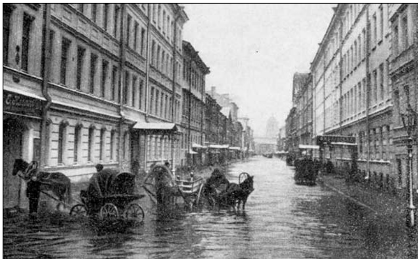
Большая Подъяческая улица во время наводнения 25 ноября 1903 года

Площади превратились в озера, улицы — в реки. По ним носились корабли и баржи, сорванные с якорей. Они ударились всей своей массой в стены домов, разрушая их. Люди карабкались на крыши, барахтались в воде, цепляясь за доски, могильные кресты, обломки зданий. В подвалах Императорской Публичной библиотеки плавали сомы. Одно семейство оказалось на дне огромного пустого металлического котла. Лошади и коровы почти все погибли в стойлах и каретных сараях, и вода носила их раздувшиеся трупы.