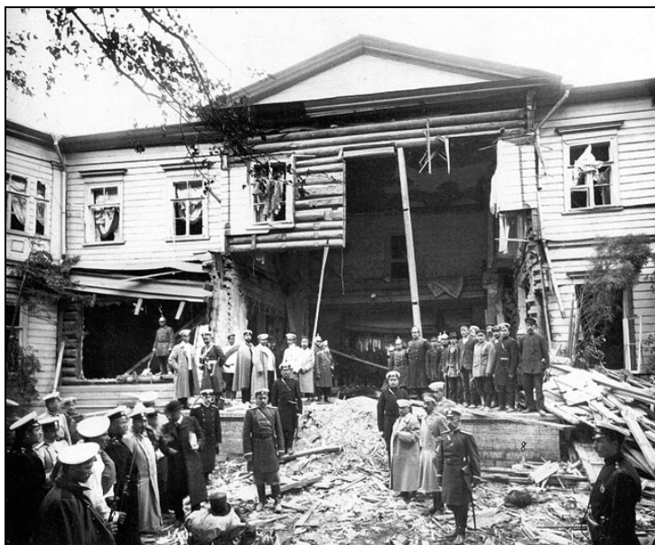
Взрыв на даче премьер-министра П. А. Столыпина 12 (25) августа 1906 года.