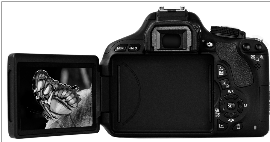
Рис. 1.2. ЖК-дисплей можно отвести в сторону и поворачивать вверх или вниз, чтобы снимать было максимально удобно

Скорее всего, когда вы откроете коробку с новым фотоаппаратом, в первую очередь возникнет желание проверить возможности именно ЖК-дисплея. Но мне не хотелось бы детально описывать, как с ним обращаться, поскольку подробную информацию об этом можно найти в руководстве пользователя фотоаппарата. Вместо этого приведу несколько полезных советов, непосредственно касающихся работы с ЖК-дисплеем.