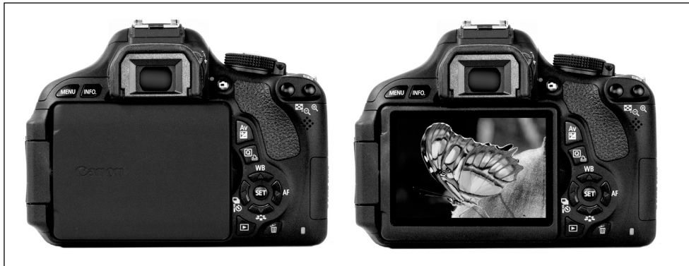
Рис. 1.1. Здесь продемонстрированы лишь два возможных положения ЖК-дисплея

на рис. 1.1, справа ). В конкретной ситуации, для большего удобства, можно открыть ЖК-дисплей и повернуть его под таким углом, который больше всего удобен для текущей съемки (рис. 1.2).