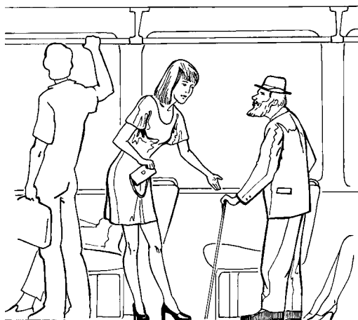
Рис. 1.3. Уступить место пожилому человеку должен каждый, в том числе и молодая женщина

• мужчина, уступая место женщине, говорит при этом: «Садитесь, пожалуйста», «Прошу вас, садитесь». Женщина должна