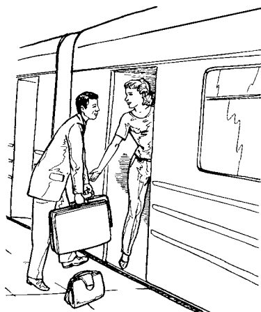
Рис. 1.2. Оказать помощь женщине при посадке в транспорт — признак воспитанности и культуры мужчины

Недопустимо, когда молодой человек сидит, а пожилая женщина с хозяйственными сумками в руках стоит рядом. Как правило, молодые люди в таких ситуациях ощущают всю неловкость своего