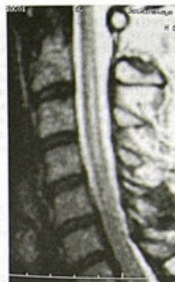
Рис. 9-66. Признаки глиоза спинного мозга на месте бывшей ранее кисты

Данные говорят о высокой важности точного соблюдения техники вмешательства, с учетом узости одностороннего оперативного доступа, морфологических данных конкретного случая. В данной ситуации область глиоза спинного мозга располагалась со стороны развития болевого синдрома, также