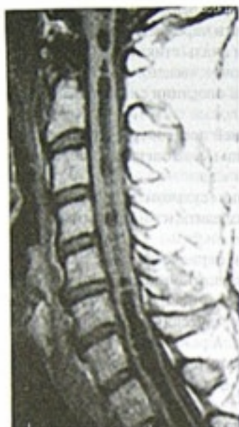
Рис. 9-64. Сирингомиелия, сирингобульбия

ногах, центрального пареза мышц правой руки, тогда же появилась указанная боль.