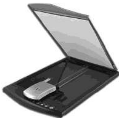
Рис. 1.9. Сканер потребительского класса из нижнего ценового сегмента в большинстве случаев не подойдет для оцифровки малоформатных диапозитивов или негативов

Каждый из подходов имеет свои достоинства и недостатки. Если вам требуется оцифровывать фотоснимки стандартных размеров, вам подойдет один из простых планшетных сканеров нижнего ценового сегмента (до 100 евро). Уже с помощью такого устройства вы вполне сможете добиться приемлемых результатов (рис. 1.9).