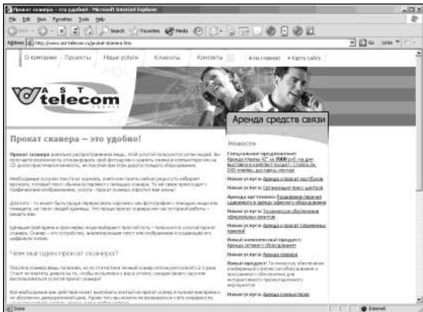
Рис. 1.10. Прокат сканера — это услуга, которой пользуются многие современные люди