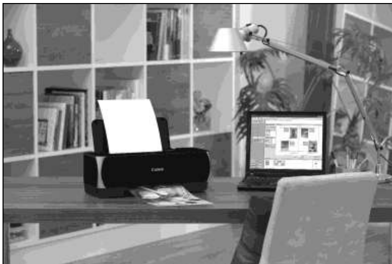
Рис. 1.7. Если у вас имеется фотопринтер, вы в любой момент можете распечатать как весь архив, так и только наиболее ценные фотографии

Само собой разумеется, что оцифрованную фотографию в любой момент и без всяких проблем можно и распечатать. Для этого даже нет необходимости обращаться в фотолабораторию. Вы вполне можете подобрать подходящий вам по цене и техническим параметрам цветной принтер и пользоваться им для печати снимков на фотобумаге (рис. 1.7).