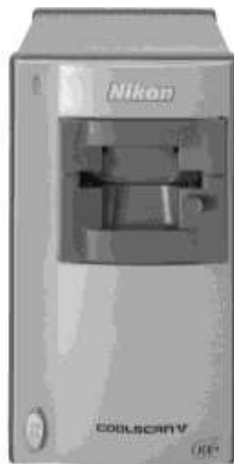
Рис. 2.4. Пленочные сканеры для малоформатных материалов работают с ощутимо более высокими разрешениями, нежели простые планшетные сканеры