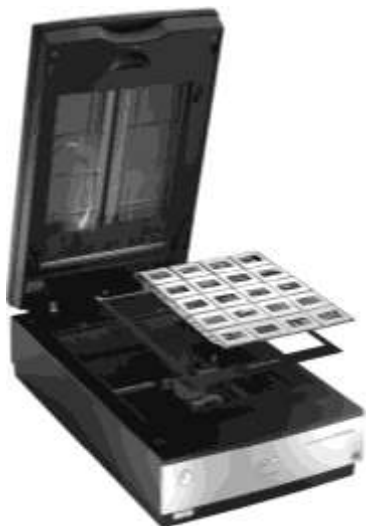
Рис. 2.3. Многие фотосканеры могут оснащаться дополнительными аксессуарами для фиксации и одновременного сканирования нескольких фрагментов пленок и одиночных слайдов, что существенно ускоряет работу

сканерами. В данном случае эффективная разрешающая способность достигает значений 3 600 dpi и более высоких. Конечно, в результате такого существенного повышения точности и качества, пленочные сканеры и стоят существенно дороже, чем большинство планшетных сканеров. Как правило, при покупке нового пленочного сканера вам следует рассчитывать на затраты, исчисляемые трехзначными суммами в евро. Кроме того, вам следует приготовиться и к дополнительным затратам на вспомогательные приспособления — например, автоподатчики, которые предназначены для подачи в сканер одиночных диапозитивов, предлагаются на рынке по ценам от 1 000 евро и более.