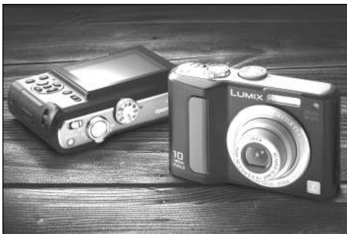
Рис. 1.1. Цифровые камеры давно уже вытеснили с рынка аналоговые устройства

Мир фотографии в процессе своего развития давно стал цифровым. Сегодня уже само собой разумеется, что фотосъемка ведется цифровой камерой (рис. 1.1). Довольно скоро вырастет целое поколение, из которого почти никто не только не сможет самостоятельно проявить фотопленку, но даже и зарядить ее в фотоаппарат. Если вы хотите спасти от забвения ваши старые снимки, связанные с множеством воспоминаний, и сохранить их на будущее, вам необходимо оцифровать 1 свои аналоговые фотоматериалы 2 . С одной стороны, вы наверняка слышали о том, что эта задача очень сложна. И действительно, легкой ее не назовешь — это, в любом случае, будет очень долгий, трудоемкий и кропотливый процесс. С другой стороны, и пугаться заранее все же не следует, тем более что эта работа может доставить вам немало радости.