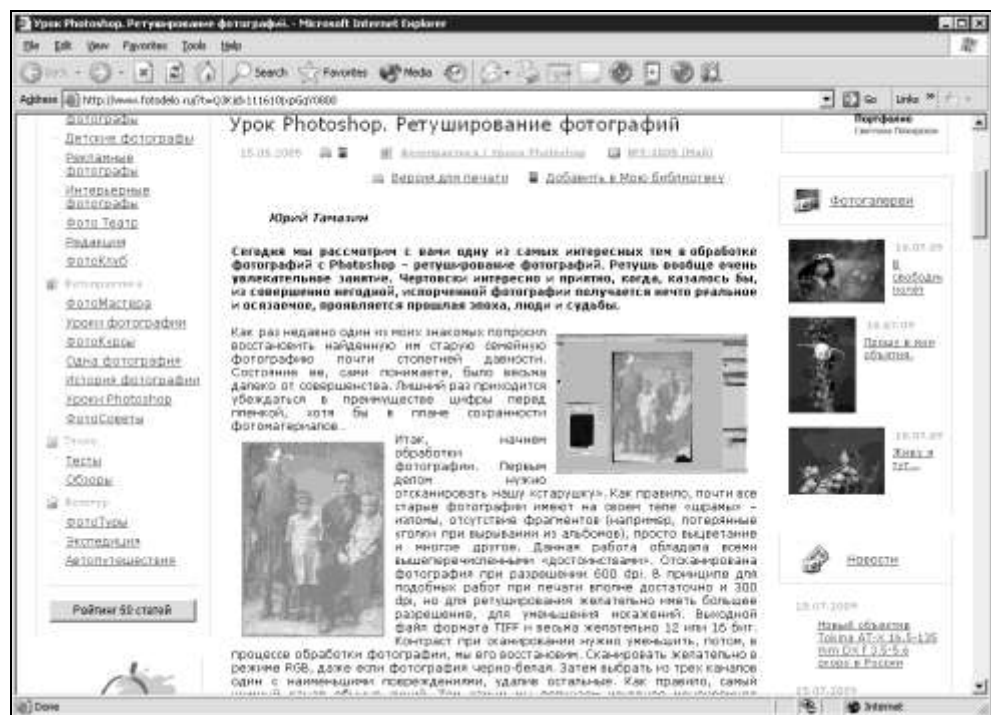
Рис. 1.6. После оцифровки вам будут доступны и дополнительные возможности по ретушированию и реставрации фотографий ( http://www.fotodelo.ru )

С помощью современных программ для работы с изображениями возможно устранить эти повреждения всего лишь несколькими щелчками мыши. Такие услуги предлагаются большинством современных фотостудий и лабораторий, правда, если вам требуется восстановить большое количество старых фотоматериалов, приготовьтесь затратить довольно внушительную сумму денег. Впрочем, такие программы обработки изображений, как Adobe Photoshop, Adobe Photoshop Elements, Corel PhotoImpact и др., позволяют даже новичкам самостоятельно восстановить и отреставрировать старые фотографии так, чтобы они выглядели, как будто их только что принесли из фотостудии (рис. 1.6).