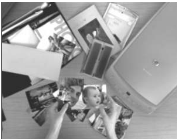
Рис. 1.8. С помощью планшетного сканера можно выполнять оцифровку бумажных фотографий, диапозитивов и негативов

Наиболее известным видом сканера является планшетный сканер 20 , который пригоден для оцифровки всех видов бумажных фотографий. Если такой сканер дооснастить дополнительными приспособлениями, то его можно будет применять и для оцифровки прозрачных материалов — как негативов, так и диапозитивов (рис. 1.8). Кроме простых и недорогих планшетных сканеров имеются и продвинутые дорогие модели, способные работать с более высокими разрешениями. Существуют варианты сканеров потребительского класса, которые оптимизированы для работы с негативами и диапозитивами и могут работать с малоформатными изображениями (35-миллиметровая пленка).