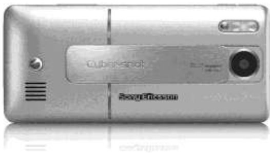
Рис. 1.2. Портативные цифровые "мыльницы", встроенные в мобильные телефоны, обретают все больше и больше возможностей и даже начинают составлять конкуренцию компактным камерам

С появлением искусства цифровой фотографии 12 изменились как методы съемки, так и способы демонстрации фотографий. В особенности этому способствовала тенденция к развитию цифровых "мыльниц", встроенных в мобильные телефоны (рис. 1.2).