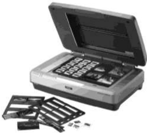
Рис. 2.2. Многие планшетные сканеры позиционируются и как устройства, пригодные для сканирования прозрачных пленок

Во многих современных моделях сканеров такое приспособление уже встроено в стандартную крышку, и по этой причине дополнительными приспособлениями обзаводиться не приходится. При использовании таких моделей нужный эффект достигается просто за счет настройки осветительной системы. Большинство таких устройств, предлагаемых потребителям под названием "фотосканеров", по сравнению с простыми планшетными сканерами обладают и более высоким разрешением, что делает возможной оцифровку малоформатных диапозитивов и негативов с вполне приемлемым качеством. Чтобы в процессе оцифровки не происходило смещения сканируемых материалов, предлагаются специальные приспособления для фиксации пленок и одиночных диапозитивов, вставленных в рамки (рис. 2.3).