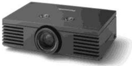
Рис. 1.3. С помощью ноутбука и проектора можно организовать и классический вечер показа диапозитивов

Кроме того, набирают популярность электронные фоторамки 16 (рис. 1.4). Показать снимки на этих небольших жидкокристаллических экранах можно с флеш-накопителей через USB или, например, даже передать их через беспроводную сеть с настольного компьютера.