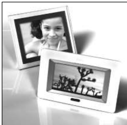
Рис. 1.4. В цифровых фоторамках вы можете продемонстрировать свои любимые фотографии по-новому