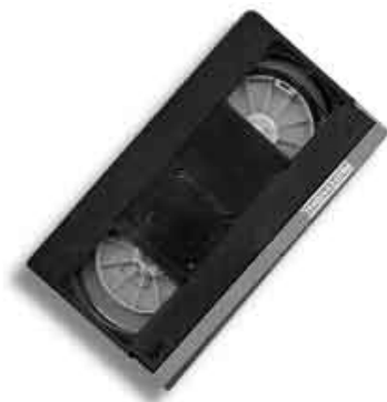
Рис. 1.3. Видеокассета VHS

Возможности формата VHS (Video Home System — Домашняя Видео Система) ограничены разрешением 240 телевизионных линий или 320 \times 240 точек на экране ПК.