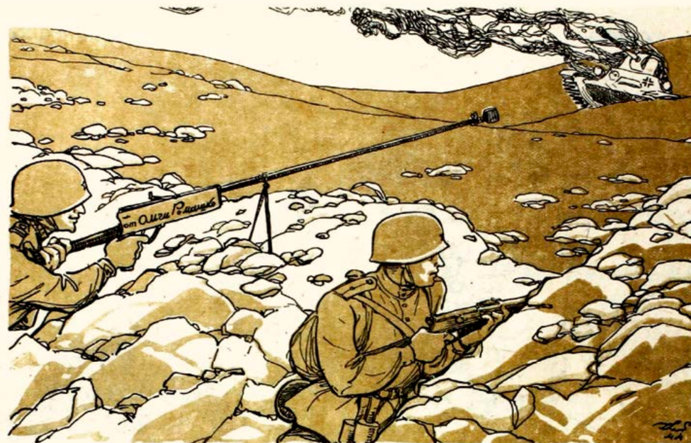
Пламенный привет от Ольги Ромашко!