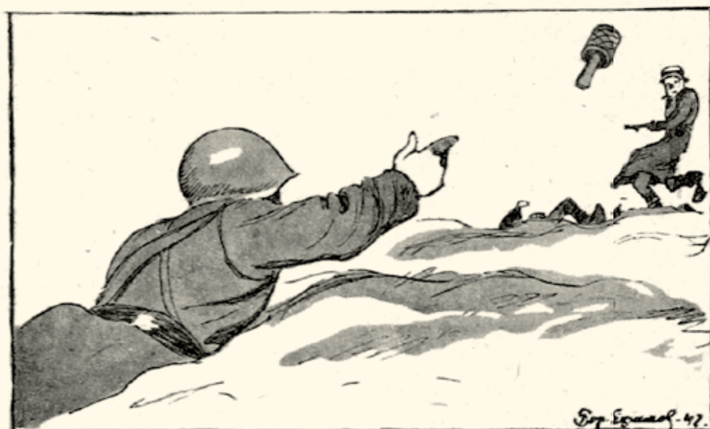
...Обер-лейтенанта же он уничтожил вне очереди.