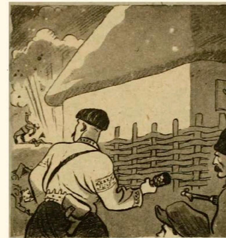
«Вечера на хуторе близ Диканьки».