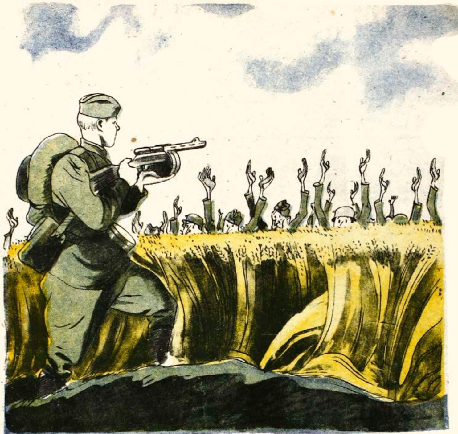
Уборочная кампания на Украине.