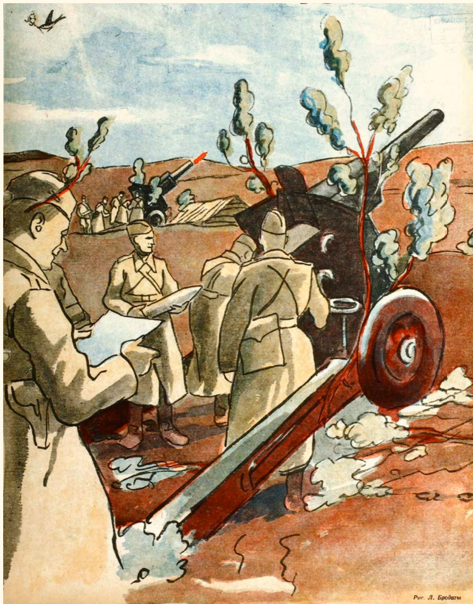
Рис. Л. Бродаты