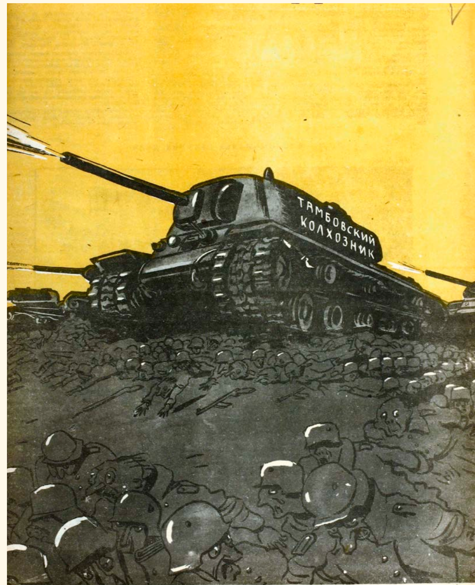
УБОРОЧНАЯ КАМПАНИЯ В РАЗГАРЕ Тамбовская фрицекосилка.