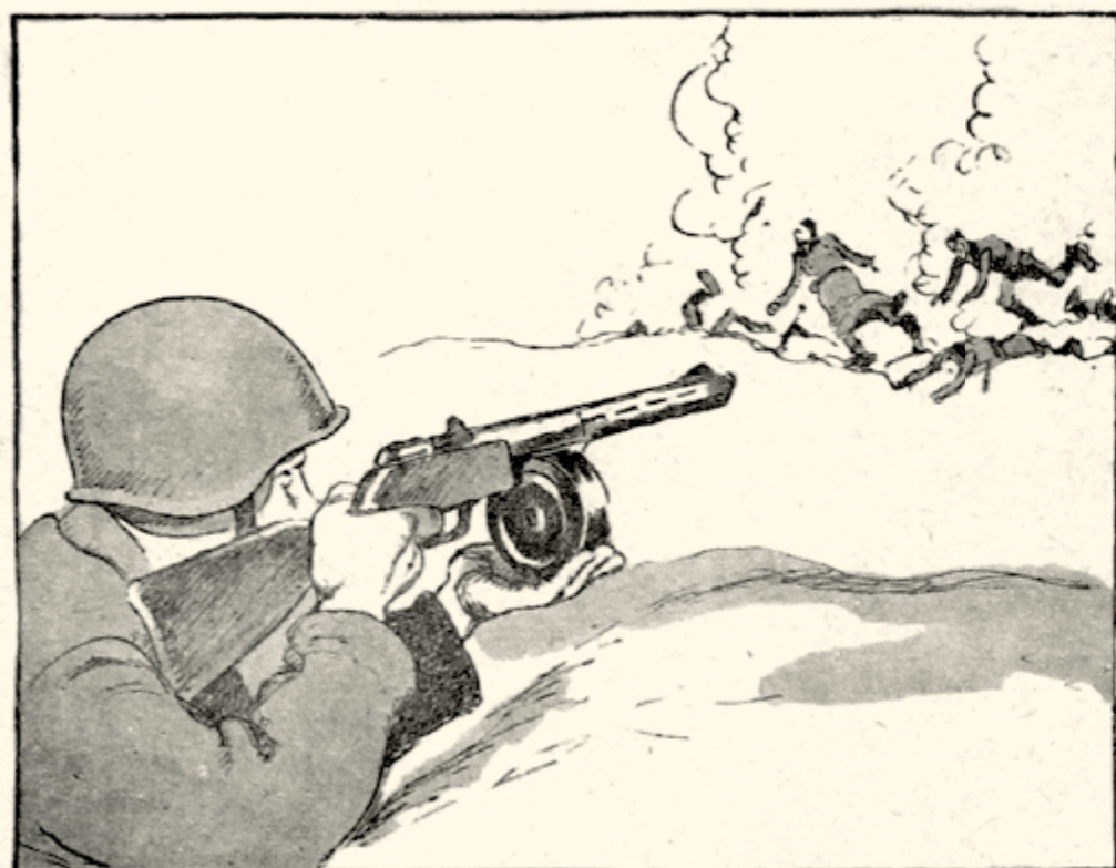
Двумя очередями автоматчик Федотов уничтожил этих...