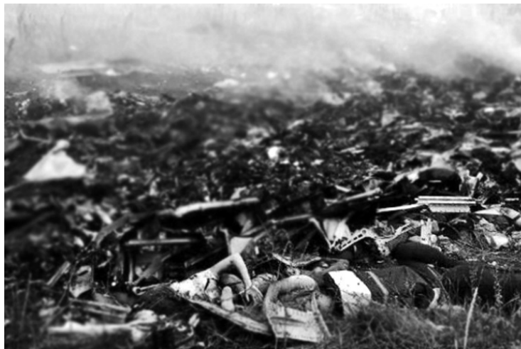
Одно из мест падения фрагментов «Боинга» и тел пассажиров