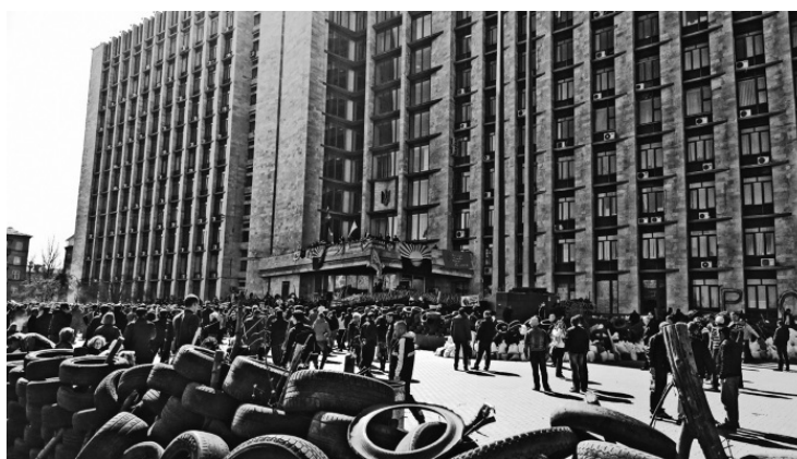
Обламинистрация Донецка после захвата восставшими дончанами

От него мы впервые услышали эту веселую фразу, которая в то время имела угрожающе-многозначительный оттенок. Копать окопы. Это было универсальное наказание. Провинившихся и нарушителей отправляли на передовую копать окопы. Мероприятие это сулило его участникам богатый и яркий, но не всегда длительный жизненный опыт.