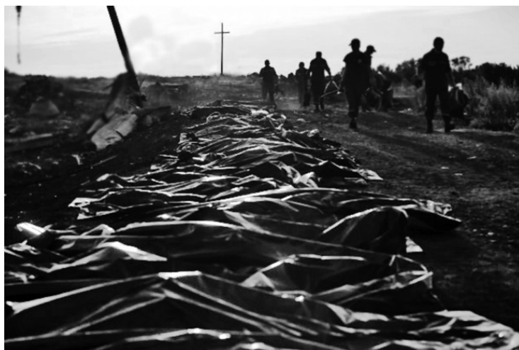
Сбор тел погибших при взрыве «Боинга»