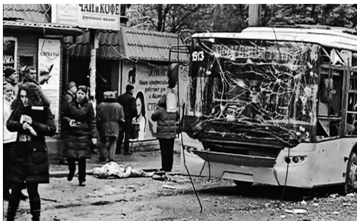
Место артиллерийского обстрела украинскими войсками района «Боссе» Донецка

В связи с этим завод обстреливался регулярно. Но из-за слабой подготовки артиллеристов, изношенности используемых орудий снаряды часто летели мимо, как случилось и в тот раз.