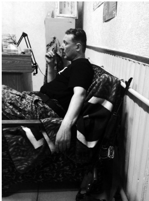
Министр обороны Игорь Стрелков в один из приступов отчаянья

(Позже, в одном из своих первых последонбасских интервью, сам Стрелков так будет говорить о своей попытке оставить Донецк: