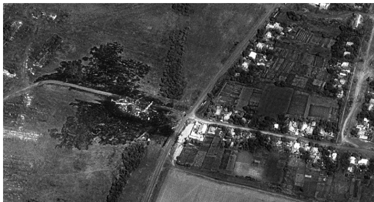
Снятое с воздуха место падения «Боинга»

Сразу же после заседания пришло сообщение о сбитом малазийском «Боинге». Владимир Антюфеев, ранее уже утвержденный первым вице-премьером по правоохранительным органам, на место происшествия ехать отказался категорически, заявив, что «по этому делу он светиться не должен», и поручил отправиться туда мне. Да я и сам бы так поступил. К тому же туда помчался и премьер, и в итоге к месту падения самолета мы ехали вместе с Александром Бородаем в его машине.