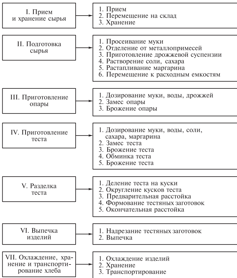
Рис. 1.1. Структурная схема технологического процесса производства хлебобулочных изделий

На складах тарного хранения муки (ТХМ) мешки с мукой помещают на деревянные стеллажи высотой от пола около 15 см. Мешки укладывают штабелями по 10... 12 рядов по высоте.